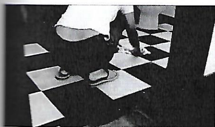
11. Posadzkę wmyć odpowiednimi środkami nie zapominając o kątach.