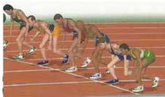
Rysunek 1 Start wysoki

W lekkoatletycznych konkurencjach biegowych obowiązują dwa rodzaje startów: niski i wysoki, które stosowane są w zależności od długości dystansu. W biegach krótkich (indywidualnych i sztafetowych do 400 m włącznie), wykorzystywany jest start niski. W biegach średnich i długich (od 800 m i dłuższych), zawodnicy rozpoczynają rywalizację ze startu wysokiego.