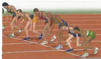
Rysunek 1 Start wysoki

W lekkoatletycznych konkurencjach biegowych obowiązują dwa rodzaje startów: niski i wysoki, które stosowane są w zależności od długości dystansu. W biegach krótkich (indywidualnych i sztafetowych do 400 m włącznie), wykorzystywany jest start niski. W biegach średnich i długich (od 800 m i dłuższych), zawodnicy rozpoczynają rywalizację ze startu wysokiego.