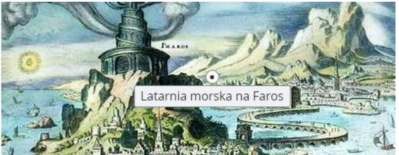
Latarnia morska na Faros