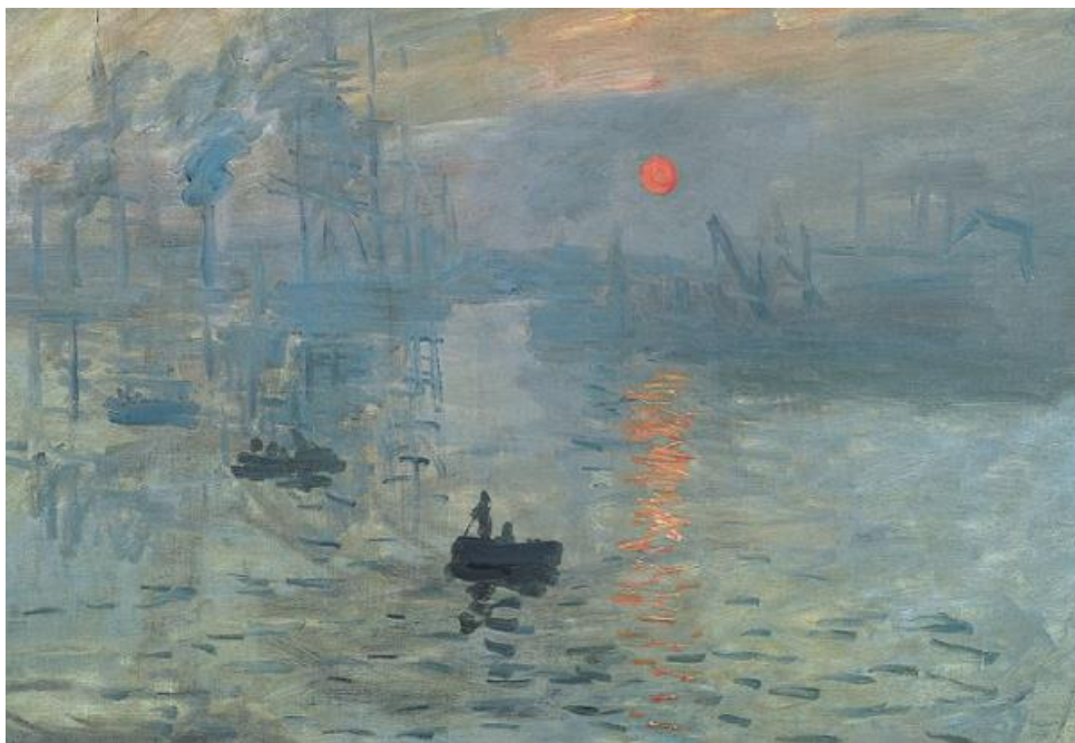
Claude Monet "Impresja wschód słońca"

Nowe zjawiska w muzyce XX wieku związane są z wrażeniami plastycznymi, obecnymi w twórczości Claude'a Debussy'ego. Kierunek w sztuce, zwany impresjonizmem, wpłynął na twórczość kompozytora, który, podobnie jak malarze, starał się uchwycić nieustannie zmieniającą się rzeczywistość i utrwalić subiektywne, ulotne wrażenia, jakie w nich wywoływała.