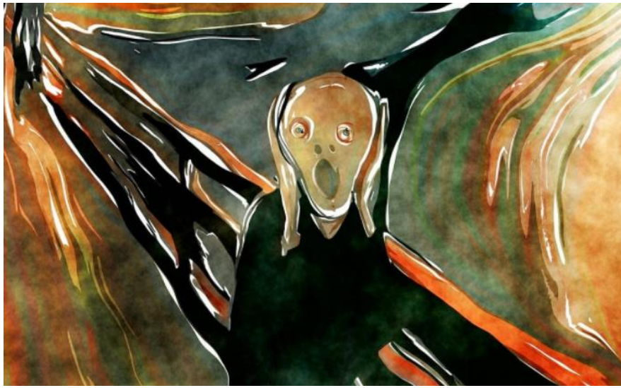
dzieło ekspresjonistyczne – Edvard Munch „Krzyk”.