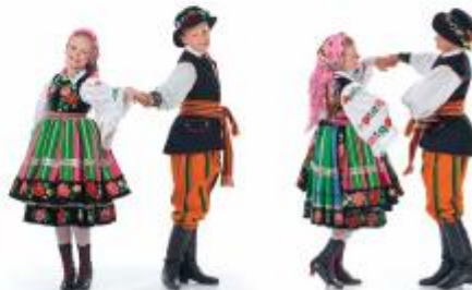
„od się – do się”