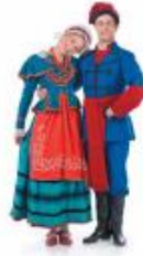
obroty w parach – śpiące