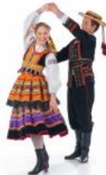
obroty w parach