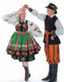
partnerka wiruje pod ręką partnera