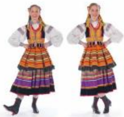
„pięta – palce”