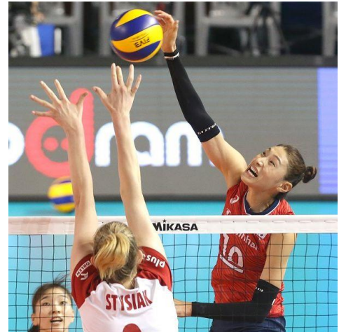
Rysunek 1 Blok pojedynczy- M. Stysiak