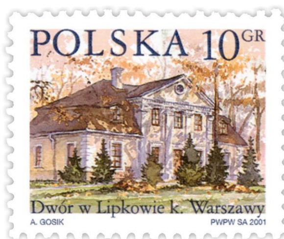
znaczek w skali 2 : 1

Skala 1 : 2 (czyt. jeden do dwóch ) oznacza, że wymiary na rysunku są 2 razy mniejsze niż wymiary rzeczywiste.