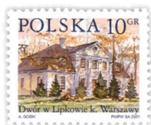
znaczek naturalnej wielkości

W każdym z tych przypadków możemy powiedzieć, że rysunki wykonano w skali. Skala określa, ile razy wymiary na rysunku są mniejsze lub ile razy są większe od wymiarów rzeczywistych.