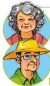
babcia i dziadek