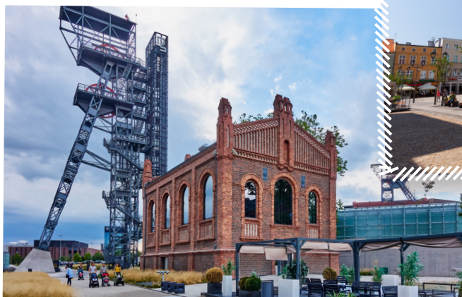
Hałdy wydobytego węgla przy gliwickiej kopalni