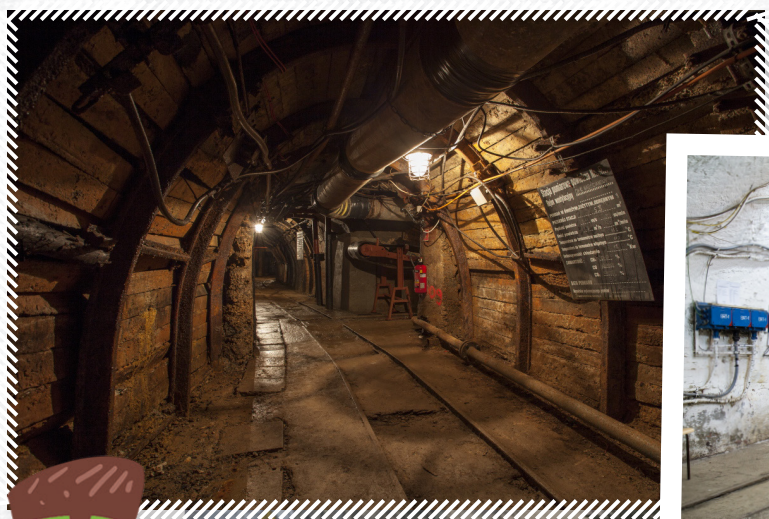
Korytarz w czynnej kopalni w Dąbrowie Górniczej