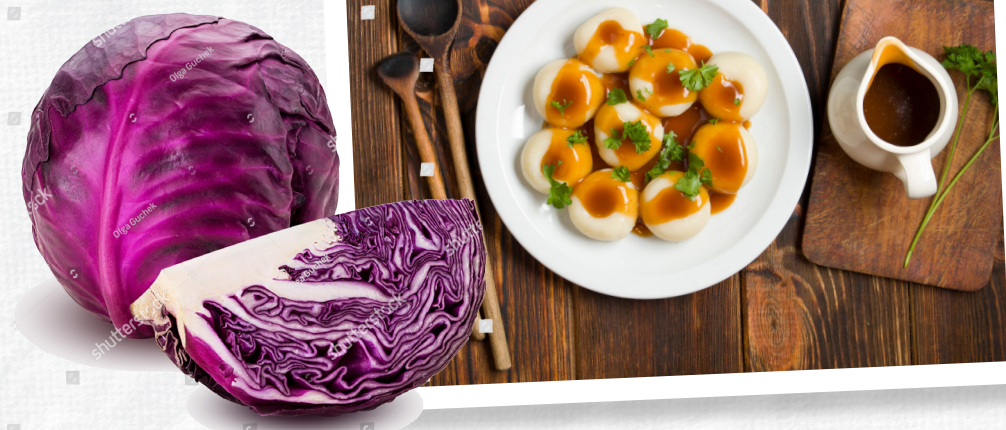
Kluski śląskie i modra kapusta

Po wyjściu z kopalni na powierzchni warto wszędzie nadstawiać ucha – może usłyszysz gwarę śląską , którą niektórzy uważają za odrębny język. Warto też spróbować pysznych potraw regionalnej kuchni, choćby klusek śląskich (z dziurką!) czy modrej kapusty .