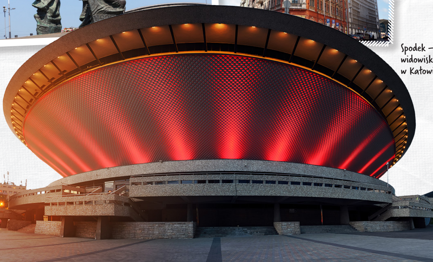
Spodek – hala widowiskowa w Katowicach