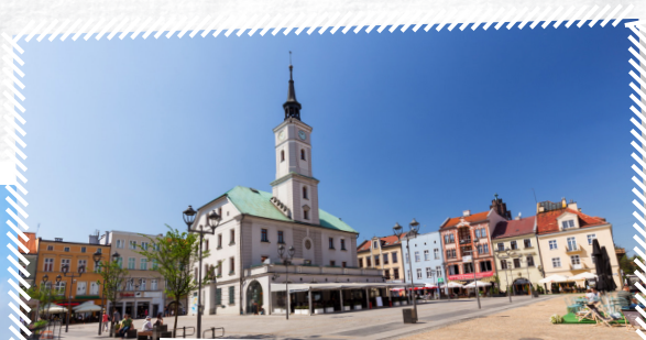
Stare miasto w Gliwicach