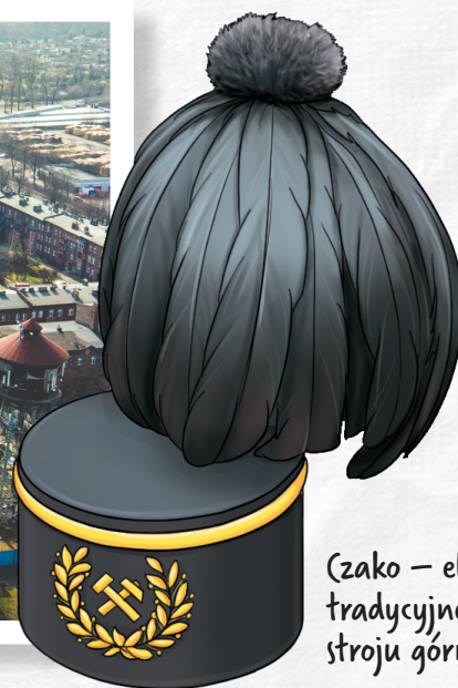
Czako – element tradycyjnego stroju górnika