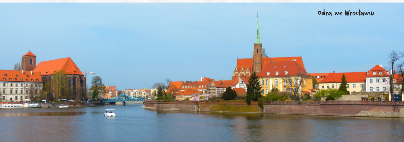
Odra we Wrocławiu

Największy dopływ Warty bywa określany „ leniwą Notecią ”. Wody Noteći płyną bowiem dość powoli poprzegradzane licznymi śluzami . Kiedyś rzeka pełniła ważną funkcję głównego szlaku transportowego północnej Wielkopolski, łącząc Wisłę z Odrą. Dziś statki bardzo rzadko korzystają z tej drogi żeglugowej, dużo częściej można zobaczyć na niej kajakarzy .