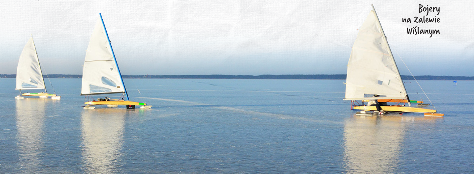
Bojery na Zalewie Wiślanym

Drugą obok Zalewu Szczecińskiego zatoką, przez którą przebiega granica Polski, jest Zalew Wiślan należący również do Rosji. Od otwartego morza odgradzony jest Mierzeją Wiślaną . Wody zalewu są bardzo płytkie (sięgają tylko do 5 m) i ciepłe. To idealne miejsce do żeglowania , a przy mroźnej zimie, kiedy wodę pokrywa lód, do jazdy bojerami .