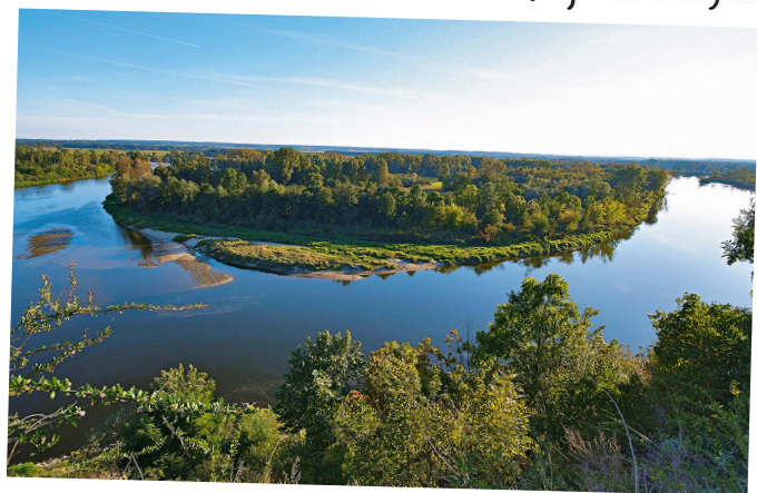
Bug – Drohiczyn

Największą rzeką w południowo-wschodniej Polsce jest Bug . Kiedyś pełnił funkcję najważniejszej drogi żeglugaowej, którą transportowano zboża do Gdańska, a dziś zachwyci cię naturalnymi krajobrazami. Warto zobaczyć rzekę na odcinku Podlaskiego Przełomu Bugu , gdzie wije się wśród pachnących borów sosnowych. Można tu też napotkać piaszczyste wydmy, łąki, nadrzeczne skarpy, które upodobały sobie ptaki. Bug uchodzi do Narwi i częściowo tworzy granicę z Białorusią i Ukrainą.