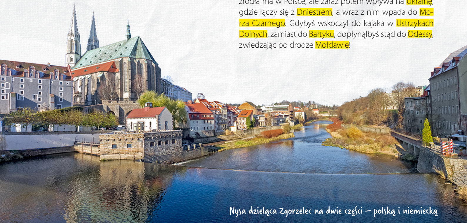
Nysa dzieląca Zgorzelec na dwie części – polską i niemiecką

Strwiąż to rzeka nie tylko o nietypowej, trudnej do wymówienia nazwie, ale również płynąca w przeciwnym kierunku niż niemal wszystkie inne rzeki w naszym kraju. Swe źródła ma w Polsce, ale zaraz potem wpływa na Ukrainę , gdzie łączy się z Dniestrem , a wraz z nim wpada do Morza Czarnego . Gdybyś wskoczył do kajaka w Ustrzykach Dolnych , zamiast do Bałtyku , dopłynąłbyś stąd do Odessy , zwiedzając po drodze Moldawię !