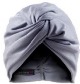
Turban - męskie nakrycie głowy